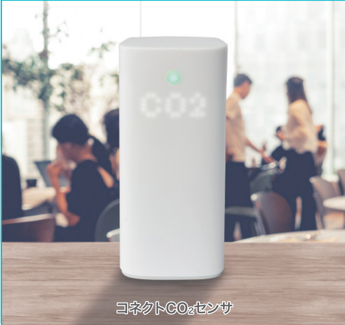
コネクトCO 2 センサ