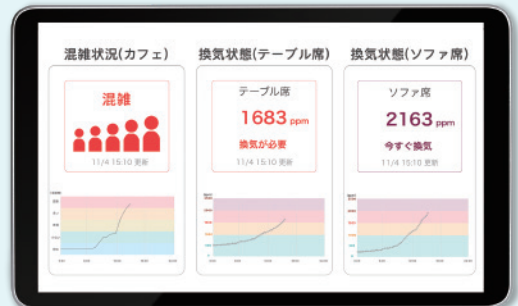
タブレット表示(イメージ)