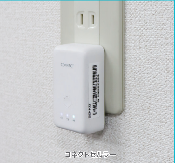
コネクトセルラー