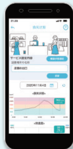
スマートフォン表示(イメージ)